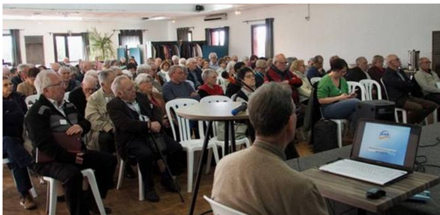
80 adhérents étaient présents à Petit-Mars